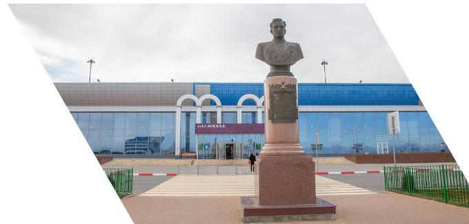
Международный аэропорт Махачкала (Уйташ) имени дважды Героя Советского Союза Амет-Хана Султана