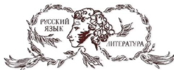
ОБЩЕСТВО РУССКОЙ СЛОВЕСНОСТИ